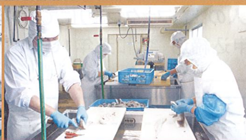
本社・水産加工場