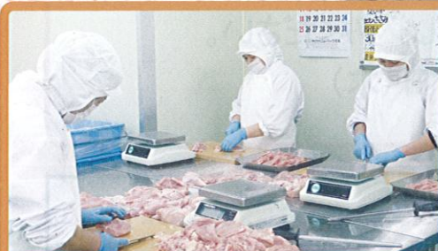
希望工場・カット室