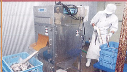
本社・水産加工場