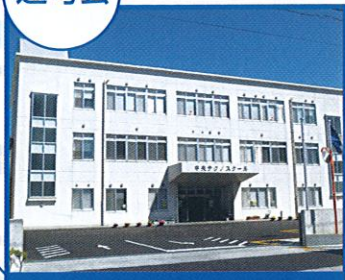
徳島県立中央テクノスクール

アクセス 交通:市営バス ●東部循環バス(左回り、右回り) 総合土木庁舎前下車、徒歩約3分 ●沖洲・南海フェリー末広四丁目下車、徒歩約15分 ※駐車:無料駐車場有り