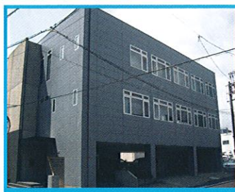
徳島ビルメンテナンス会館

アクセス 徳島市昭和町2丁目56番地 TEL.088-625-2360 ●JR阿波富田駅から徒歩で約5分。 ※専用駐車場はございません。 近隣の有料駐車場をご利用ください。