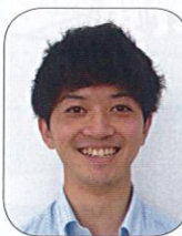
Aコート 【九州地区代表】