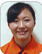
Aコート 【北海道地区代表】