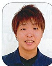
Bコート 【四国地区代表】