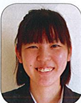
Bコート 【九州地区代表】