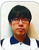
Bコート 【近畿地区代表】