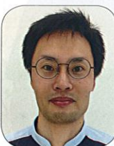
Aコート 【東京地区代表】