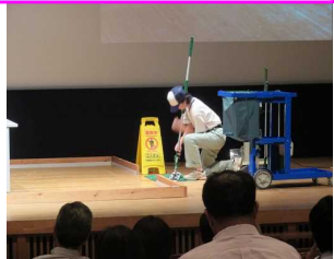
ダスターの取り付け作業