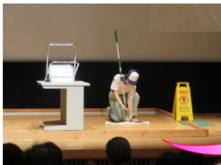
ダスターの処理 (汚れたダスターからゴミが落ちないように)