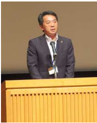
森本 教育次長 (県教育委員会)