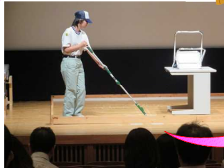
ヘッドを斜めに、拭き残しをなくす