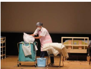
シーツは回収カートに