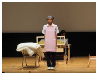
片付け終了後報告