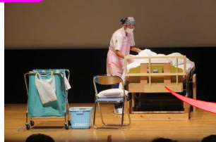
シーツの使用面を確かめ、汚さないように注意