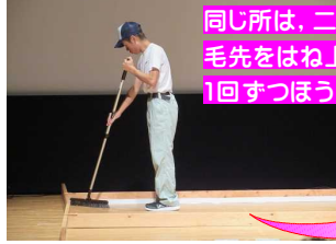
隅を掃く時は、斜め45度角度に、ほうきを入れる