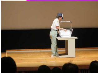
イスは机天板からはみ出さない