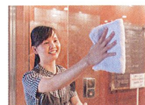
P34 特集2 「外国人技能実習生の“いま”」