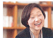
P05 Hope 錦メンテナンス株式会社