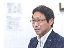
P05 Hope 株式会社トヨタエンタプライズ