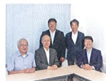
P08 特集1 緊急座談会「大規模災害におけるビルメンテナンスの役割とは？」