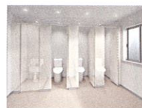
P42 人と空間にやさしい環境管理