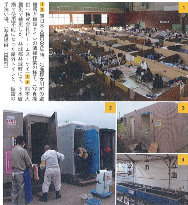
1 東日本大震災発生時、社団法人川町の避難所と仮設トイレの清掃作業の様子。2 熊本大震災で被災した、益城郡益城町にて、下水道損で使用不能になった屋外トイレと、仮設の手洗い場。

Text = Toru Kishinami